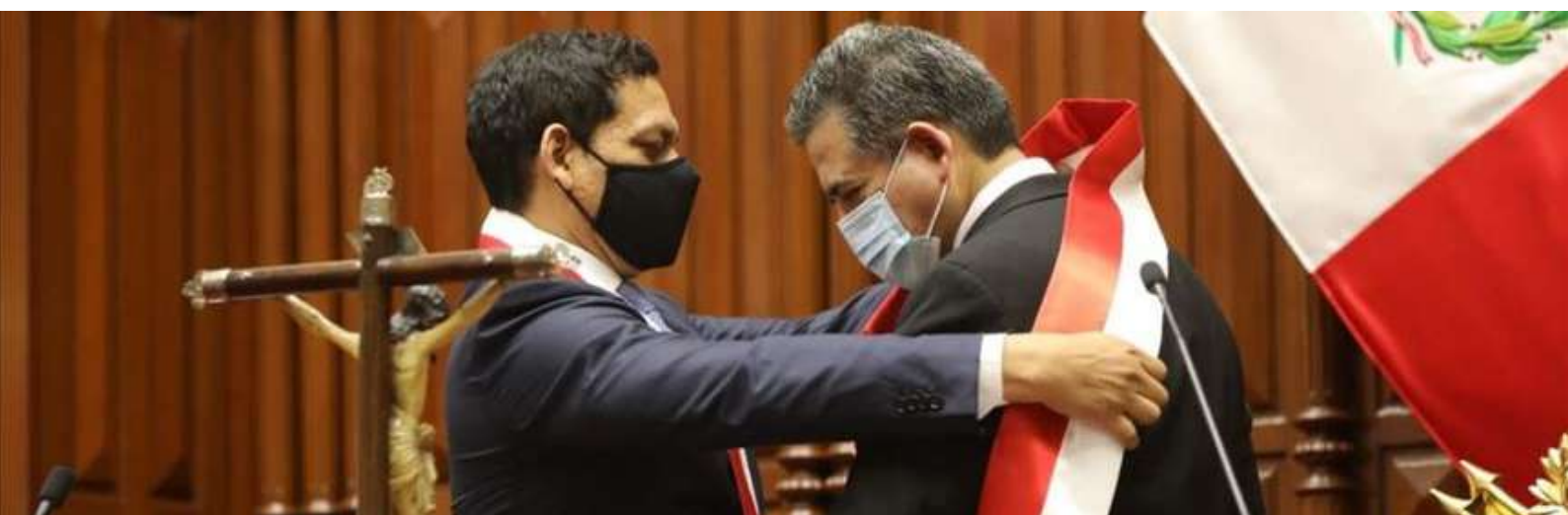
Golpe de mano de noviembre de 2020. Manuel Merino De Lama, por entonces presidente del Congreso peruano, asume la presidencia. El Pueblo le responderá desde las calles y 5 días después deberá renunciar.

Ante esto, a mediados de octubre de 2020, parlamentarios de Unión por el Perú (del nacionalista Antauro Humala), Frente Amplio (el progresismo de Verónica Mendoza), entre otros, presentaron una segunda moción de “vacancia por incapacidad moral” que pronto prosperó porque, sobre la propuesta, también cabalgaron los demás partidos de derecha. A inicios de noviembre, la moción fue aprobada por 105 votos a favor, 19 en contra y 4 abstenciones. Vizcarra se vio obligado a dejar la presidencia de la República, que fue ocupada por Manuel Merino De Lama , desatando una serie de importantes protestas sociales urbanas, con muy pocos precedentes en los años recientes.