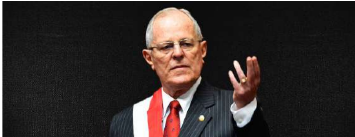
Pedro Pablo Kuczynski (PPK)