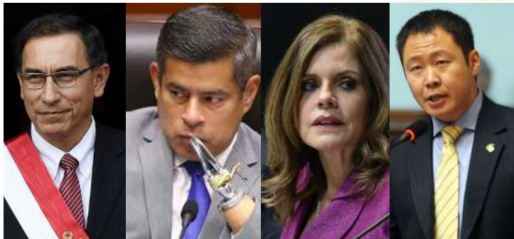
De izquierda a derecha: Martín Vizcarra, Luis Galarreta, Mercedes Araoz y Kenji Fujimori