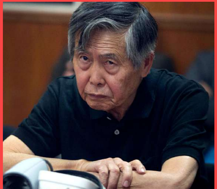
Alberto Fujimori, presidente peruano entre el 28 de julio de 1990 y el 22 de noviembre de 2000

La escandalosa corrupción, la violencia política, la censura de la prensa y el surgimiento de nuevos problemas económicos determinaron la caída de Alberto Fujimori a finales del año 2000. El por entonces presidente, en el marco de una gira internacional, huyó a Japón y el Congreso declaró la vacancia presidencial por "permanente incapacidad moral".