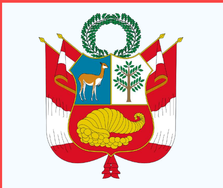
Escudo de la República del Perú, con su cuenco de la abundancia, desde donde caen monedas de oro

¿Colapsará el neoliberalismo tardío? Confiamos que si. Castillo y “Perú Libre” son hoy el color de las esperanzas colectivas de la región.