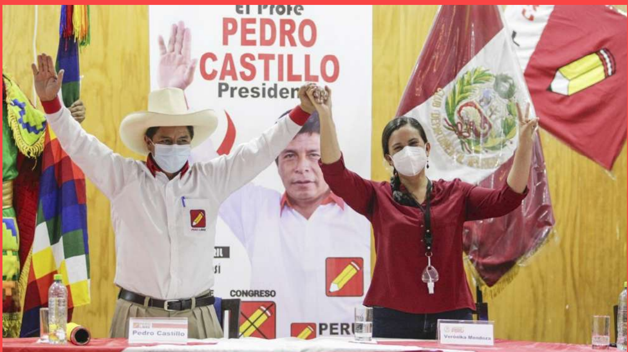
Unidad del campo popular. Verónica Mendoza sella su acuerdo con Pedro Castillo de cara a la segunda vuelta