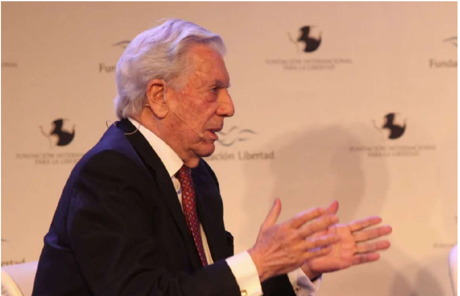
Mario Vargas Llosa, disertando en evento de la Fundación Libertad

Bajo el título “Que la Pandemia no sea un pretexto para el autoritarismo”, en abril de 2020 Vargas Llosa y su Fundación patrocinaron un comunicado, ampliamente difundido por medios como Infoemba, donde confundía medidas de cuidado con “suspensión del Estado de Derecho”. José María Aznar, Mauricio Macri, Álvaro Uribe Vélez, Ernesto Zedillo, Luis Alberto Lacalle y María Corina Machado están entre los primeros firmantes.