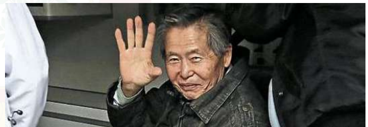
Alberto Fujimori, liberado tras el indulto

En la nochebuena de ese año, Pedro Pablo Kuczynski indulta a Alberto Fujimori , quien logra permanecer en libertad hasta octubre del 2018. Todo indica que el indulto era parte de un "pacto de gobernabilidad". Las roscas y la corrupción volvían a teñir la política peruana.