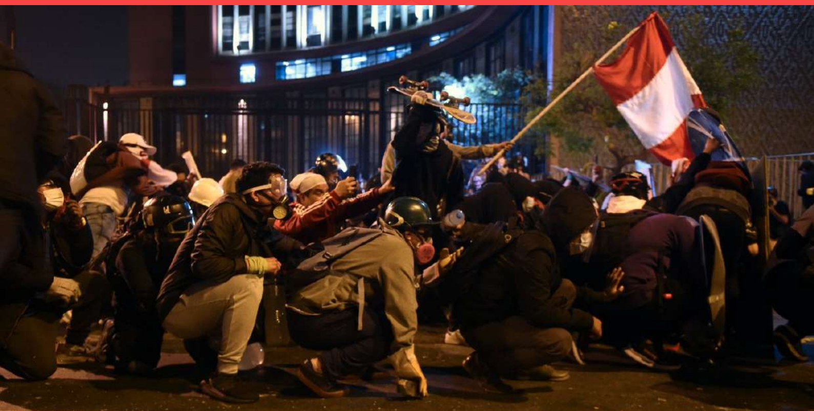
Protestas populares de noviembre de 2020 en Perú

En síntesis, la crisis político-institucional no deja de ser funcional al neoliberalismo. Sagasti emprendía, a las pocas horas de asumir, un rumbo de gobierno afín a los intereses del capitalismo transnacionalizado.