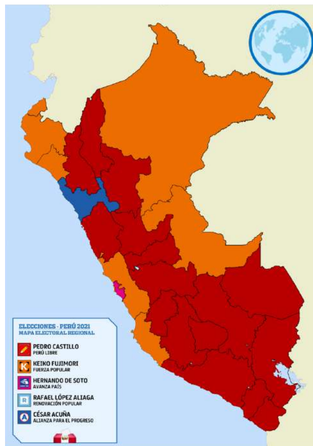
Ganador por departamento