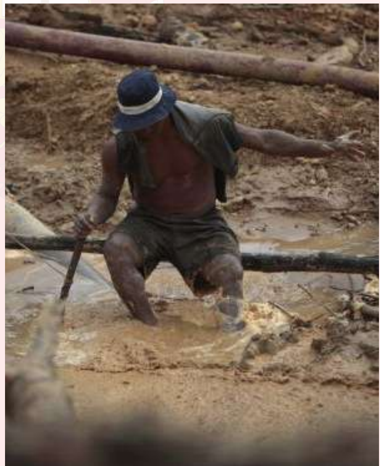
Las ETNs también adquieren el metal de pequeños recolectores que hacen el trabajo en condiciones de precariedad extrema

El gobierno de Fujimori emprendió un proceso de privatización del sector minero que ha atraído a más de cien empresas extranjeras al país, por lo que las extracciones han aumentado en un 500%. El 40% de las inversiones procede de Canadá, y el resto de Australia, Estados Unidos, México, Sudáfrica, China y Reino Unido. Las antiguas empresas estatales fueron desactivadas en favor de empresas transnacionales (ETNs). Entre las que operan en el país se encuentran Barrick Gold, XStrata, BHP-Billiton, Teck-Cominco, Mitsui, Anglo American, Cia Vale do Rio Doce, Corporación Chinalco, Zijin Group, Milpo, Newmont, Freeport-McMoRan, Copper & Gold Inc, Grupo México, IAM Gold, Peñoles, Mitsubishi, Rio Tinto, Gold Fields, Chinalco, Votorantim, Sumitomo, Pan American Silver, entre otras.