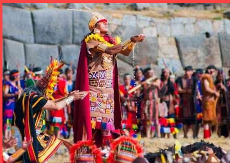
En pocos días, los pueblos andinos festejan el solsticio de invierno, el Inti Raymi. En la América toda se espera que en Perú, en este 2021 festejen el nacimiento de un nuevo sol, luego de la larga noche neoliberal