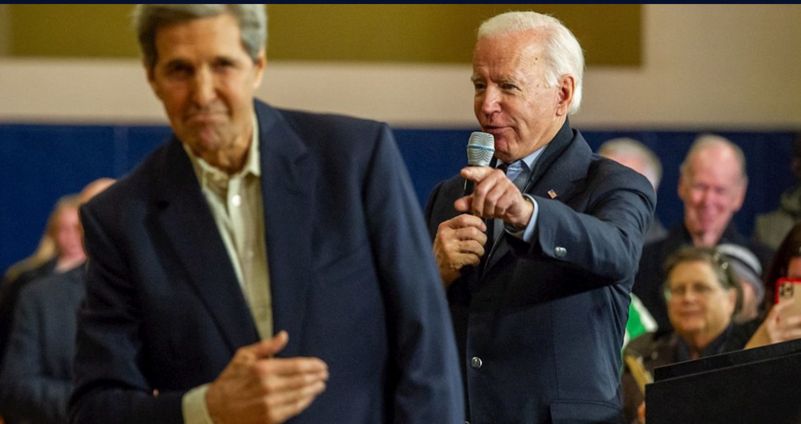
John Kerry, ex secretario de Estado de EEUU, fue designado como Consejero Presidencial para el Clima.